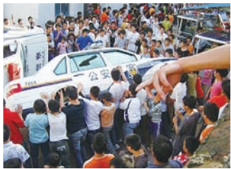
2008年6月28日贵州瓮安少女被奸杀，上万民众抗议并推翻警车。

BBC中文网评论提到：“柏林墙从建到塌的历史表明，把人去人性化的意识形态与社会制度终究不能长久。”共产主义是个重政权轻人民、反人类的体制，中国古语说“失民心者亡”，东德民众在20年前汇聚浩瀚力量和平解体共产体制，更带来全球共产阵营垮台。