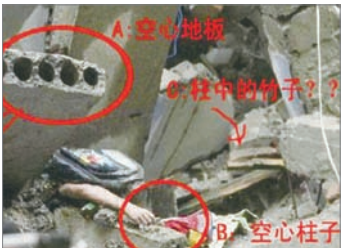
2008年川震中害死学生的豆腐渣工程

说明中国对信息的控制。美国国会众议院则通过决议，呼吁中国政府释放黄琦和同样因帮助川震受难者调查死因遭到审讯的四川作家谭作人。