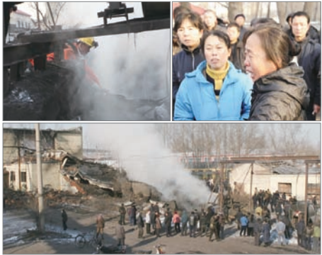
11月21日黑龙江新兴煤矿矿难造成104人死亡

中国矿业恶劣的安全记录令人忧心，近三年来，遇难人数高达1,698人。统计显示，这几年中国煤矿事故死亡人数是世界其他主要采煤国家死亡总人数的4倍，中国百万吨煤死亡率为美国的100倍、印度的10倍。