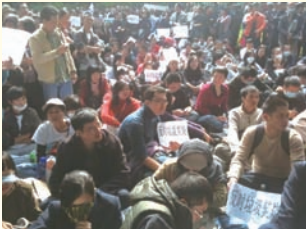
广州民众抗议建焚烧炉静坐现场

11月23日广州两千名番禺区市民自发聚集到市政府，抗议广州当局继续“垃圾焚烧发电厂”项目。事件得到中国网络关注，但在媒体上遭到封杀。据抗议民众透露，已建成运转的李坑焚烧厂，已给附近居民身体造成巨大伤害、环境遭污染，政府却无视这一切。