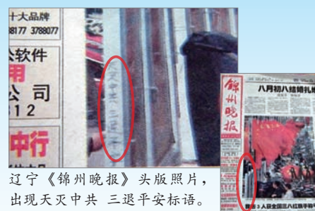
辽宁《锦州晚报》头版照片，出现天灭中共 三退平安标语。