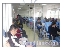
上海医院人满为患