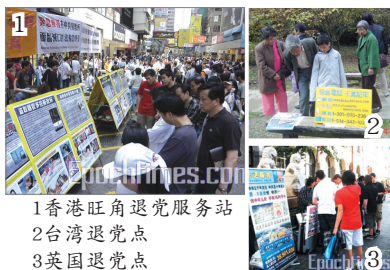
1 香港旺角退党服务站 2 台湾退党点 3 英国退党点

随着中国三退大潮风起云涌，海外正义人士也开始声援中国民众之三退义举，近来世界各地如澳洲墨尔本、美旧金山、纽约、波士顿、意大利、爱尔兰、巴黎、马来西亚、新加坡等地民众举行大游行和集会，声援中国勇士三退。