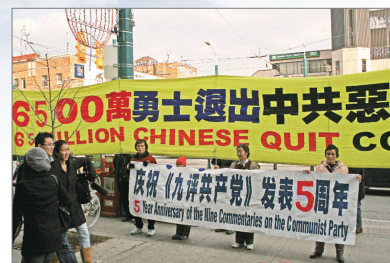
多伦多集会声援6400万人三退

欧议会副主席爱德华·麦克米兰-斯考特鼓励更多人加入退出中共的行列。西方社会欢迎一个没有共产党的新中国，一个中国人民期盼的而且值得拥有的中国。