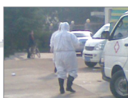
广西甲流死亡病例突增