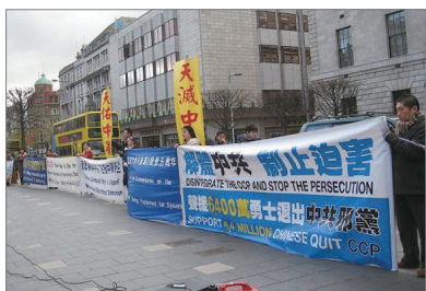
爱尔兰集会声援中国民众三退