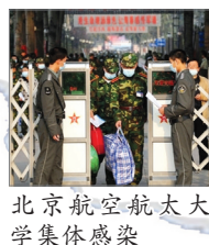
北京航空航天大学集体感染

广西玉林市某医院医生透露他们医院每天有4、5人死亡。据广西卫生厅工作人员表示疫情的报告只是冰山一角，可能不及实际数字的1/10，甚至1%。目前H1N1已在中国大陆大爆发，为了追求政治业绩，中共故意隐瞒疫情，甚至对疑似病患根本不进行H1N1的检测。专家指出，这种做法将导致医学界无法及时掌握病毒的传播和可能出现的基因突变。如果猪流感和禽流感病毒结合形成新的病毒，那将是大灾难。