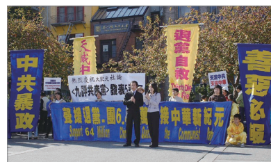
旧金山声援6400万人三退