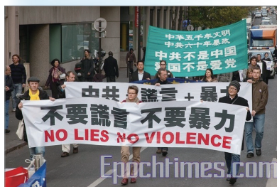
巴黎声援中国退党游行