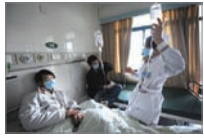
安徽合肥医院甲流患者