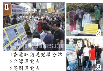
1 香港旺角退党服务站 2 台湾退党点 3 英国退党点