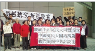
36位上海访民庆祝中国冤民大同盟成立。十多人真名退出中共。