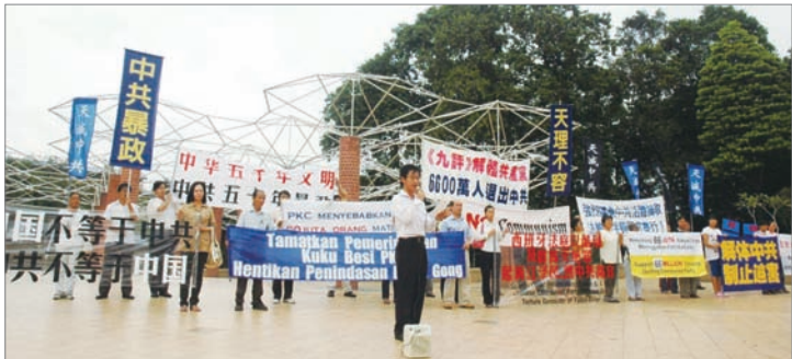
马来西亚退党服务中心声援6600万三退勇士集会现场

2004年11月，大纪元时报发表《九评共产党》社论，把中共的邪恶本性、谎言暴政揭露无疑。由此引发中国民众在大纪元网站上的“三退”(退出共产党/团/队)大潮，至今已逾6600万人。