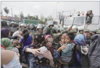
中共军队镇压新疆 妇女相拥而泣

2009年7月5日，新疆乌鲁木齐发生震惊中外的暴力流血事件。7月5日傍晚，一些新疆维吾尔族人在乌鲁木齐市举行和平示威，要求当局为广东韶关斗殴事件负责，但是和平示威最后变成一场血腥屠杀。官方报告称197人死亡，1721人受伤。这是中共在1989年六·四屠杀后第二次军警大规模开枪镇压示威群众。