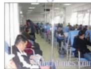
上海医院人满为患