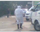
广西甲流死亡病例突增