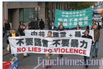
巴黎声援中国退党游行