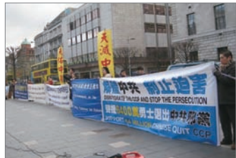
爱尔兰集会声援中国民众三退