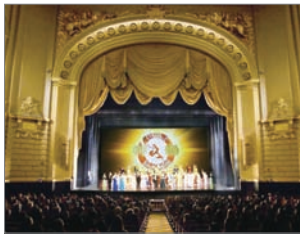
神韵2010年世界巡回演出

2009年底，被国际顶级艺术界公认为“世界第一秀”的美国神韵艺术团开启在世界巡回的演出。神韵艺术团所展现的纯真、纯善与纯美的中华传统艺术，无不令人惊喜、赞叹。