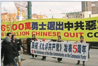
多伦多集会声援6400万人三退

欧议会副主席爱德华·麦克米兰-斯考特鼓励更多人加入退出中共的行列。西方社会欢迎一个没有共产党的新中国，一个中国人民期盼的而且值得拥有的中国。