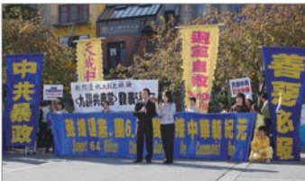
旧金山声援6400万人三退