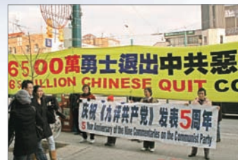
多伦多集会声援6400万人三退