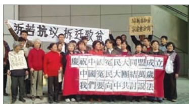
36位上海访民庆祝中国冤民大同盟成立。十多人真名退出中共。

这些声明三退勇士是顺应天意、带动世人脱离中共的勇士。他们因《九评》带来的心灵震撼而觉醒，选择发挥正义良知，告别中共。