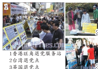
1 香港旺角退党服务站 2 台湾退党点 3 英国退党点