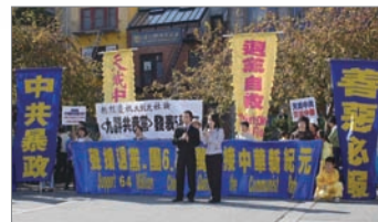
旧金山声援6400万人三退