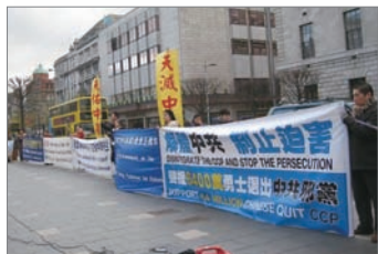
爱尔兰集会声援中国民众三退