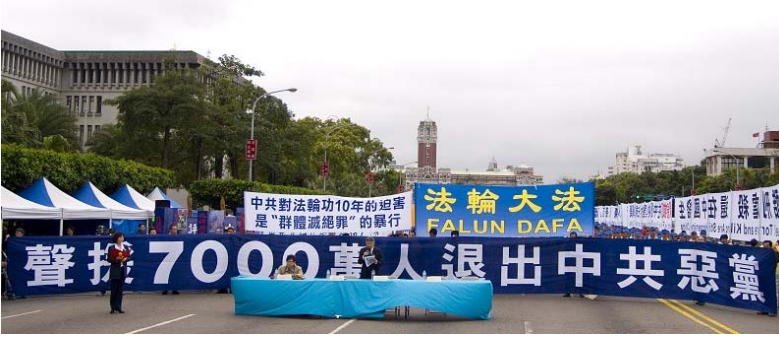
3月7日中华民国总统府前举办声援7000万三退大会

为声援在大纪元网站公开声明退出共产党、共青团、少先队三退活动人数超过 7,000 万，台湾法轮大法学会 3 月 7 日在中华民国总统府前凯达格兰大道上举办声援大会，会场集结超过 3,000 名台湾正义之士，场面浩大，旗帜飘扬，汇聚气势磅礴能量。会后并举办游行活动，队伍绕行台北闹区，目的希望更多人认清邪恶共产党，同声援这项有意义活动。