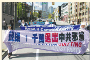
温哥华支持一千万人退出中共