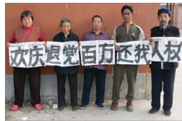
中国大陆民众欢庆百万人退党

中国人民对中共的民愤民怨，已达火山总爆发前夕，全球退党服务中心主席高大维说，广传《九评》与退出中共，是协助中国人解体中共最有效、和平的方式。