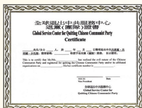
三退证书具法律效用