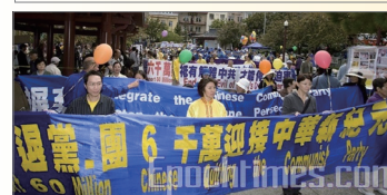
旧金山声援六千万人三退游行