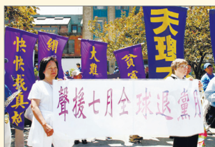
七月退党月引发党政军三退