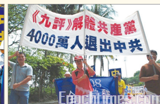
马来西亚支持四千万人退出中共