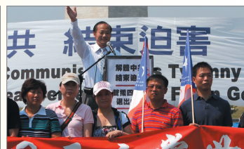
中国民主党60位成员退出中共