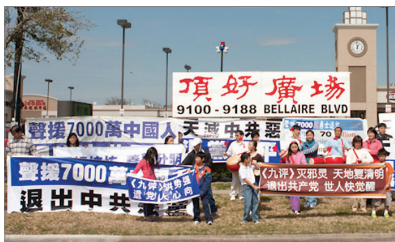
美国休士顿声援七千万华人三退