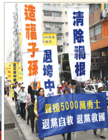
香港支持五千万人退出中共