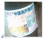
北方城市楼梯旁三退标语