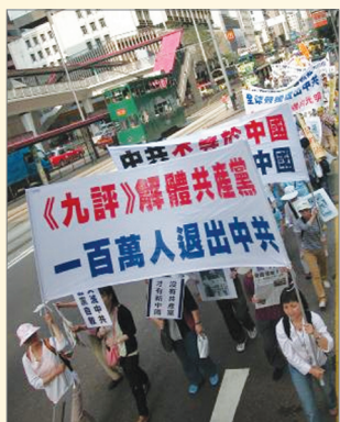
香港支持一百万人退出中共