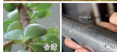
优昙婆罗花在世界各地各种材质盛开