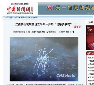
中新网：优昙婆罗花为“仙界极品”

2月27日中新网发表题为“江西庐山发现传说3000年一开优昙婆罗花”文章。中新网称，传说中三千年一开的仙界极品之花“优昙婆罗花”日前在江西省庐山被发现，18朵直径仅为1毫米的乳白色小花立即在当