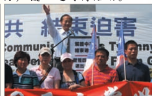
中國民主黨60位成員退出中共