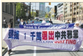
溫哥華支持一千萬人退出中共