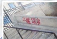
北方城市楼梯旁三退标语