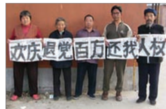
中国大陆民众欢庆百万人退党

中国人民对中共的民愤民怨，已达火山总爆发前夕，全球退党服务中心主席高大维说，广传《九评》与退出中共，是协助中国人解体中共最有效、和平的方式。