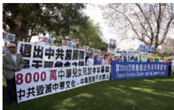
美国洛杉矶声援七千万华人三退