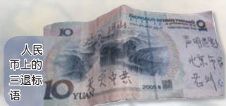
人民币上的三退标语