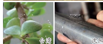
优昙婆罗花在全球各地各种材质盛开