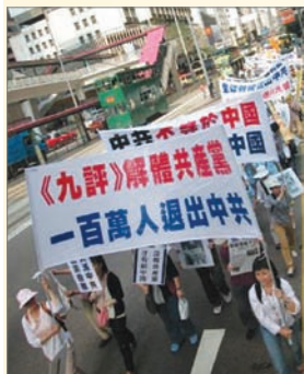
香港支持一百萬人退出中共