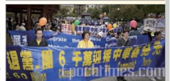
舊金山聲援六千萬人三退遊行