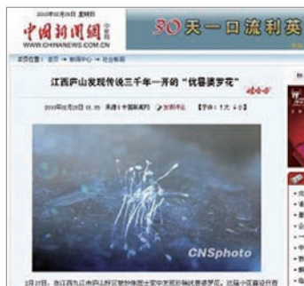
中新网：优昙婆罗花为“仙界极品”

2月27日中新网发表题为“江西庐山发现传说3000年一开优昙婆罗花”文章。中新网称，传说中三千年一开的仙界极品之花“优昙婆罗花”日前在江西省庐山被发现，18朵直