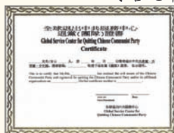
三退證書具法律效用