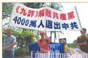
馬來西亞支持四千萬人退出中共