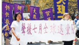
七月退黨月引發党政軍三退