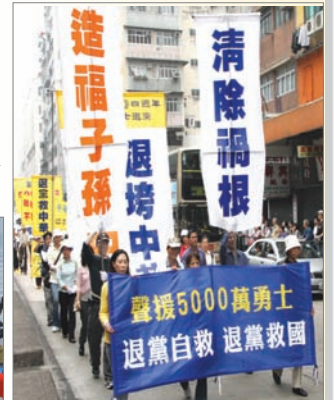
香港支持五千萬人退出中共