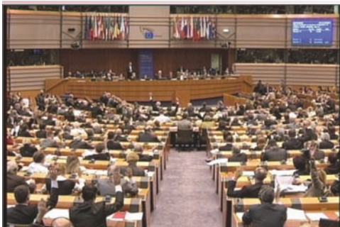
欧洲议会决议谴责共产极权暴政

国际社会公开谴责共产主义，鼓舞正在中国大陆不断高涨的退党大潮，在和平理性的精神觉醒中迅速解体世界上邪恶专制的最后围墙-中共。