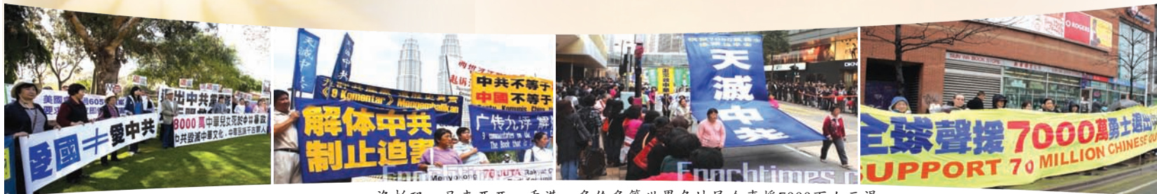
洛杉矶、马来西亚、香港、多伦多等世界各地民众声援7000万人三退

2004年《九评》发表至今已有逾七千万人在大纪元网上发表声明，退出中共党、团及队。七千万人反映中国人民不断觉醒，也象征中共已经在瓦解之中。美国资深外交官布莱恩·麦克亚当认为七千万民众的退党大潮意味着“中国人已经意识到受到中共的欺骗”，中共解体已呈燎原之势。