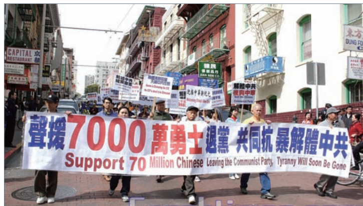
旧金山举行游行集会声援七千万人退出中共

2004年11月《九评共产党》队)大潮，在大纪元网站上公开表明退出中共相关组织的人数已突破七千万。多伦多、马