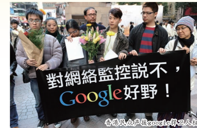
香港民众声援google捍卫人权

自2006年打入中国市场，谷歌一直配合中共网路审查，直到今年谷歌发表声明指出，1月12日，Google及另外20余家美国公司受到来自中国、复杂的网路攻击。这些攻击及所暴露的网路审查问题，加上去年以来中共进一步限制网路言论自由，使谷歌得出结论：“我们不能继续在Google.cn搜索