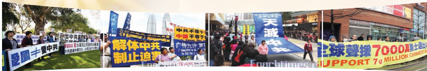
洛杉矶、马来西亚、香港、多伦多等世界各地民众声援7000万人三退

2004年《九评》发表至今，已有逾七千万人在大纪元网上发表声明，退出中共党、团及队。七千万人反映中国人民不断觉醒，也象征中共已经在瓦解之中。美国资深外交官布莱恩·麦克亚当认为七千万民众的退党大潮意味着“中国人已经意识到受到中共的欺骗”，中共解体已呈燎原之势。