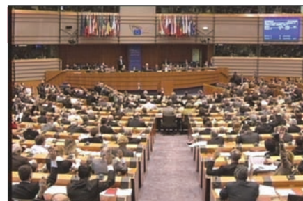
欧洲议会决议谴责共产极权暴政

国际社会公开谴责共产主义，鼓舞正在中国大陆不断高涨的退党大潮，在和平理性的精神觉醒中迅速解体世界上邪恶专制的最后围墙——中共。