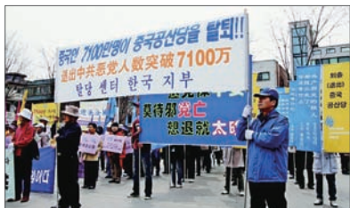
韩国声援中国民众三退