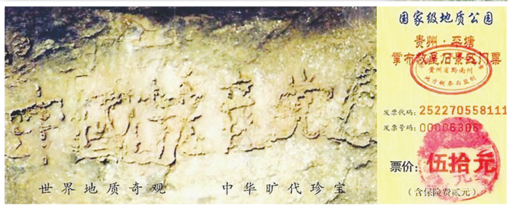
贵州掌布风景区门票上印有藏字石

2002年6月，中国贵州省平塘县掌布风景区发现五百年前崩裂的巨石断面惊现“中国共产党亡”六个大字。经三批地质专家鉴定藏字石为2.7亿年前天然形成，中共新华网隐去最后“亡”字号称救星石，鼎力宣传。