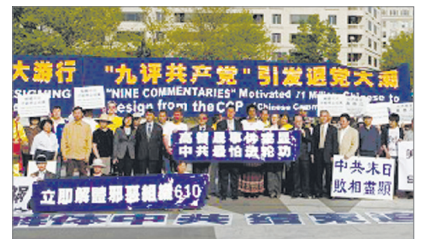
香港(左起)、马来西亚、美国西雅图、华盛顿等世界各地民众声援逾7000万人三退