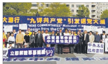
香港(左起)、马来西亚、美国西雅图、华盛顿等世界各地民众声援逾7000万人三退