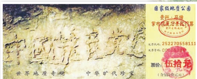
贵州掌布风景区门票上印有藏字石

2002年6月，中国贵州省平塘县掌布风景区发现五百年前崩裂的巨石断面惊现“中国共产党亡”六个大字。经三批地质专家鉴定藏字石为2.7亿年前天然形成，中共新华网隐去最后“亡”字号称救星石，鼎力宣传。