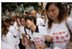
川震死难学童家长

2008年汶川地震，中共隐瞒中科院耿庆国等多位地震专家多次上书中央的预报，造成遇难和失踪人数超过八万人。今年青海玉树地震，中共依然对地震专家已上报地震局的预警未予重视，据民间统计遇难约一万多人。