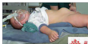
遭毒奶粉受害的中国婴儿

2003年，非典席卷全球，由于中共的新闻封锁，使得疫情的控制丧失最佳的控制时期。近年，手口足病、禽流感、甲流疫情在中国大陆流传，中共依然以所谓的“避免社会恐慌”为藉口，禁止媒体私下发放疫情消息，民众的知情权与安危受到严重威胁。