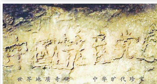
贵州掌布风景区门票上印有藏字石