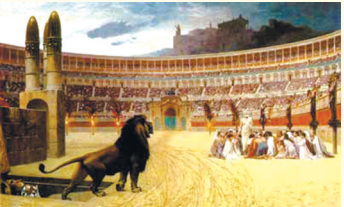
古罗马帝国迫害基督徒

历史上对正信的迫害都没有成功过，如佛教和基督教没有因被迫害而消失，反而更为传播。而行恶者也必须偿还其犯下的罪恶。 古罗马皇帝迫害基督徒以自杀告终 据罗马史学家塔西图记述，古罗马皇帝尼禄故意在罗马城纵火，嫁祸基督徒。尼禄命令将基督徒投进竞技场，这些人被猛兽活生生地撕裂咬死。他甚至吩咐人把很多基督徒与乾草捆在一起，入夜点燃，照亮皇帝的园游会。 尼禄残酷屠杀基督徒的行为激起元老院的反对和罗马人民的奋起反抗。最后，罗马军队起来造反，地方官员宣布背叛尼禄。军队和百姓围住王宫，元老院宣布尼禄为人民公敌，并判处鞭笞死刑。绝望的尼禄被迫以匕首割喉自杀，结束罪恶一生。基督教被迫害了300多年，非但屹立不倒，在以后的1500年传遍全世界。而古罗马帝国却在蛮族入侵、瘟疫和天灾中走向灭亡。伴随对基督徒的迫害，古罗马发生了多次瘟疫如黑死病，半数居民死亡的惨烈情景令人刻骨铭心。历史给人类留下了深刻的教训。